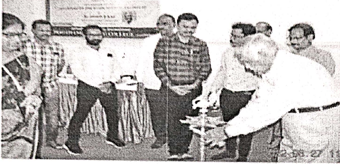
పచ్చాచలం / గంపేపల్లె, డి.వి.ఎస్. ఆగస్ట్ 27 : గంపేపల్లె మునిసిపల్ కార్యాలయ ప్రగతి ఇంజనీరింగ్ కళాశాలలో 'అసోసియేట్ ఆఫ్ ఇన్స్టిట్యూట్ సివిల్ ఇంజనీర్ (కాశీవాడ) సింబల్ ఆఫ్ డిప్లొమా' 'సివిల్ ఇంజనీరింగ్ విద్యార్థులకు అనేక అవకాశాలు తెలి