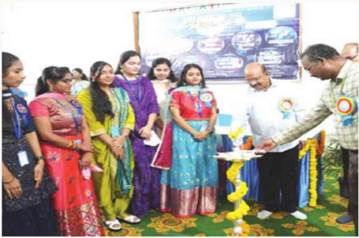
కార్యక్రమాన్ని ప్రారంభిస్తున్న ముఖ్య అతిథులు