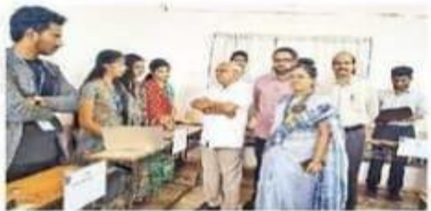
ప్రాజెక్టులను పరిశీలిస్తున్న అధ్యాపక సిబ్బంది సాంకేతికతను అందిపుచ్చుకోవాలి